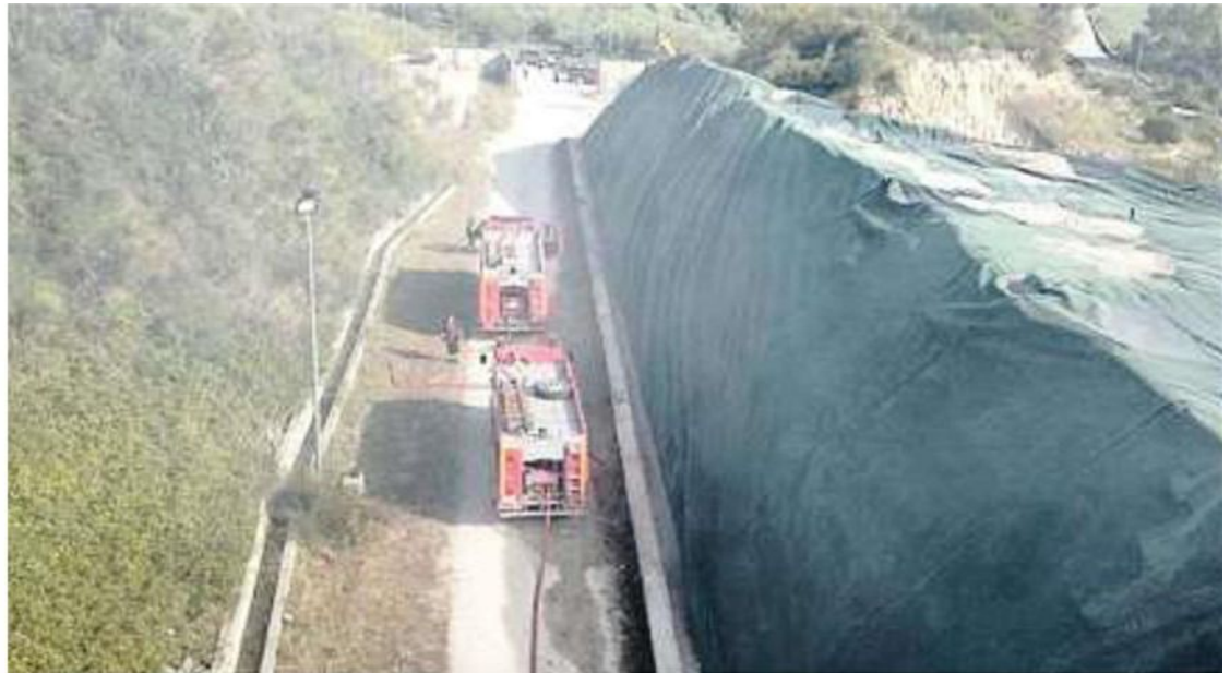
LA ZONA Sopra e in basso la situazione nell'area di Toppa Infuocata a Fragneto Monforte

SARIM E FUNZIONARI DI PALAZZO S. LUCIA GIÀ IERI NEL SITO, PRIMI TRASFERIMENTI DI ECOBALLE STABILITI PER NOVEMBRE